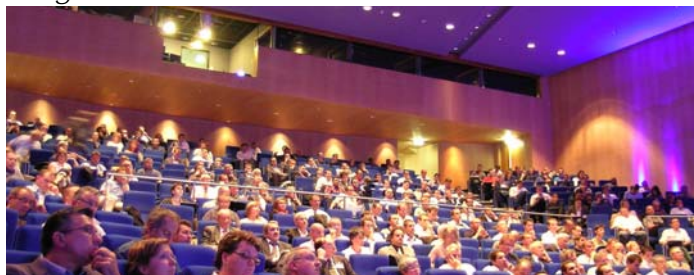
L'amphithéâtre du Centre des Congrès Pierre Baudis de Toulouse. Une seconde salle avec retransmission vidéo de la scène a été ouverte.