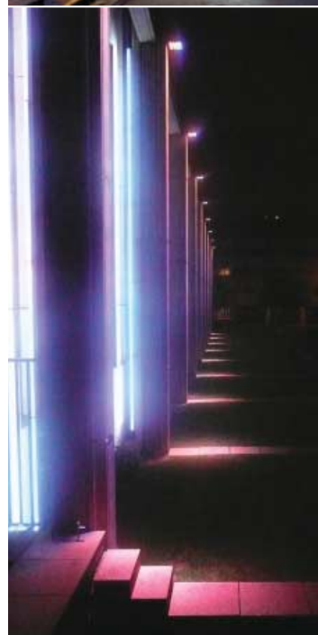
L'Hôtel de région des Pays-de-Loire