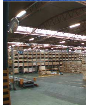
Industrie et gradation numérique