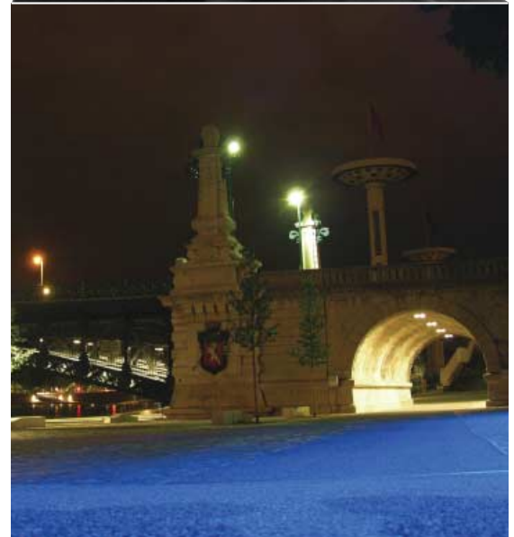
Les berges du Rhône