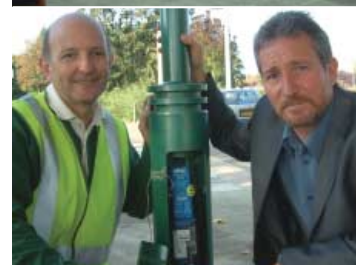
Télégestion en éclairage public