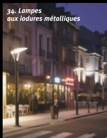
34. Lampes aux iodures métalliques