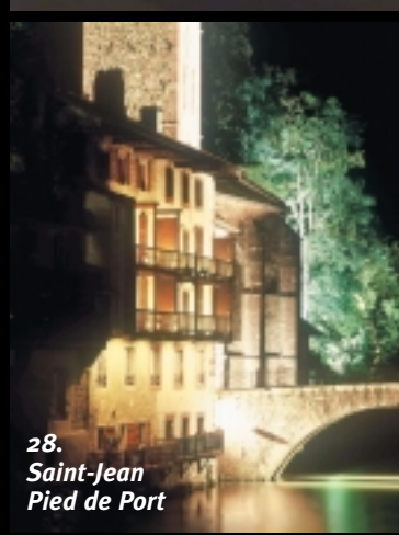
28. Saint-Jean Pied de Port