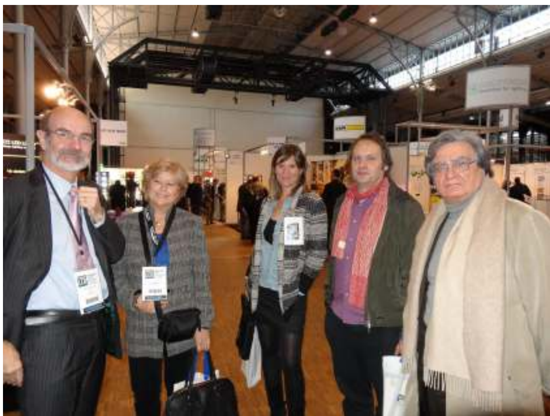
L'équipe de la Revue Lux avait fait le déplacement pour couvrir l'événement