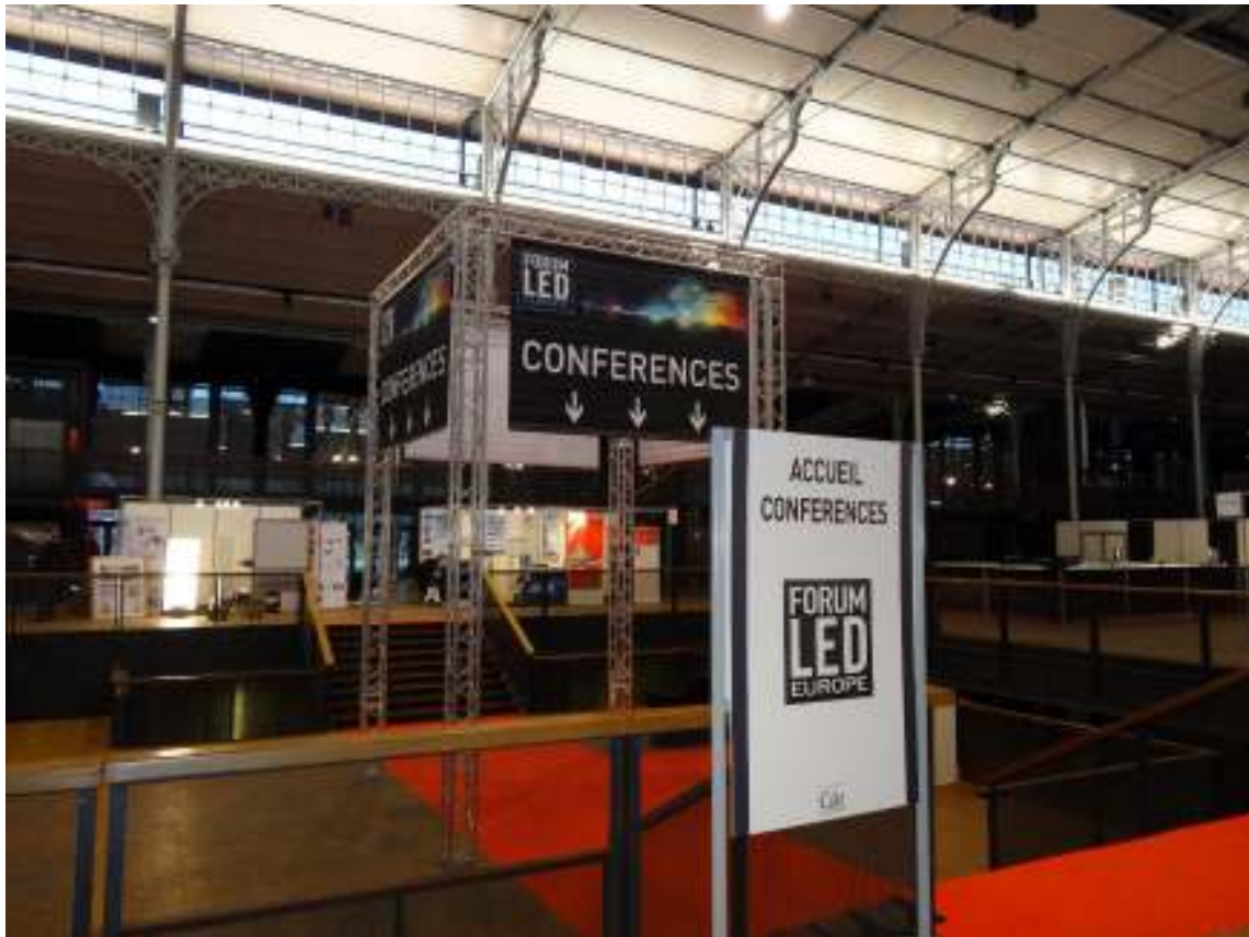
Le stand de l'AFE se trouvait juste en face des salles de conférences