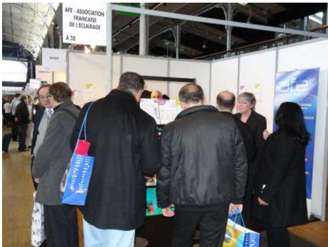
Le stand de l'AFE n'a pas désempli pendant deux jours.