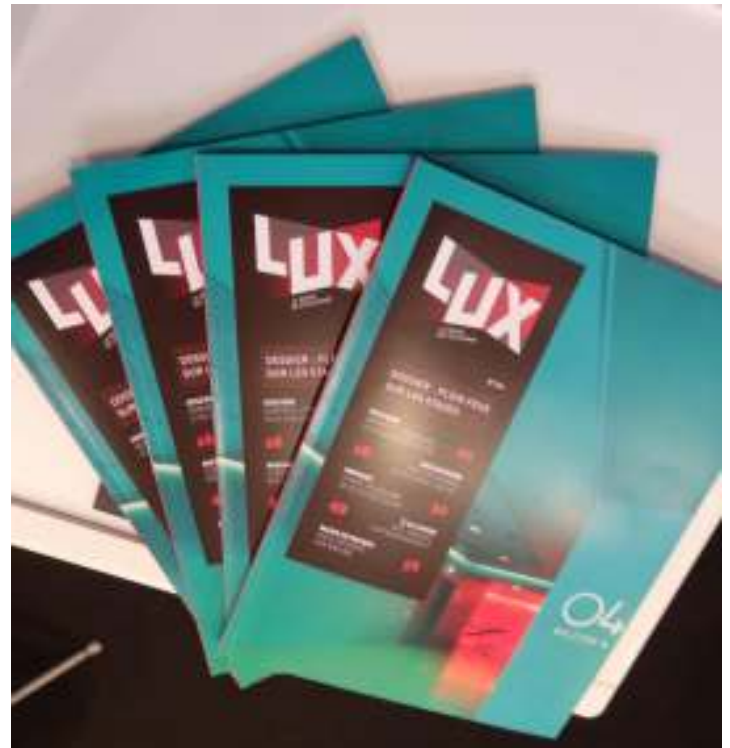
Le numéro 274 de la Revue Lux est sorti pour l'occasion. L'équipe de l'AFE avait préparé toute la documentation nécessaire pour l'occasion.