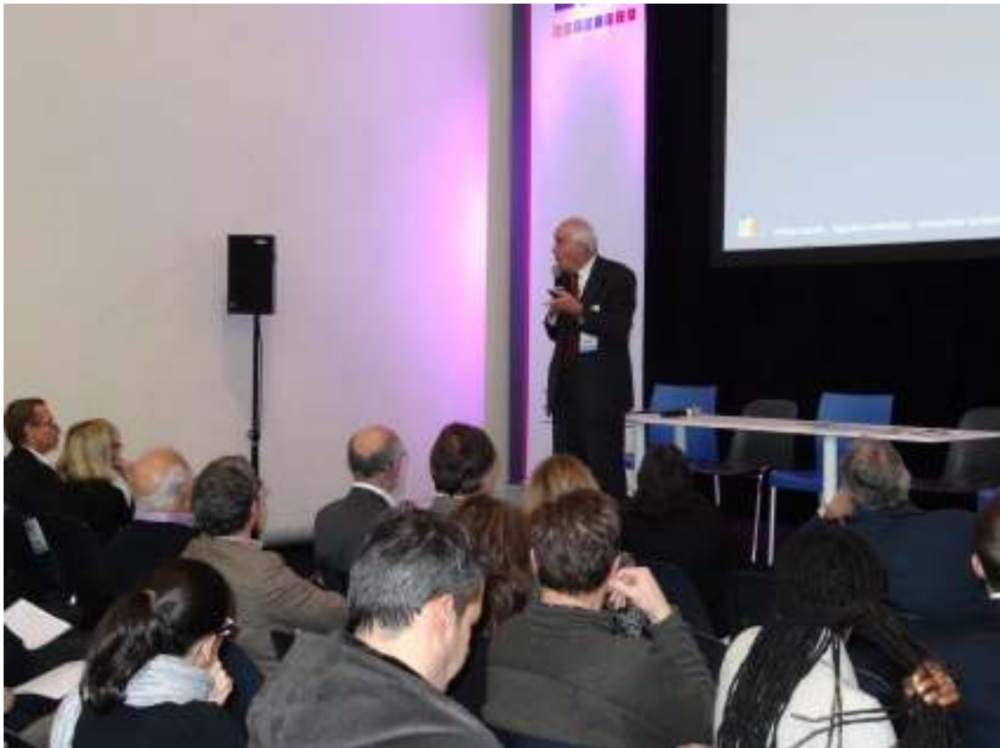
Merci à notre Président du centre régional PACA pour sa disponibilité et cette conférence réussie