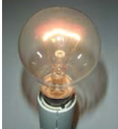
Lampe incan claire

La directive 2005/32/EC, dite EuP (Ecodesign requirements for Energy Using Products), est une directive cadre qui fixe les grands principes d'éco-conception des produits consommateurs d'énergie. Elle se décline en mesures d'application sectorielles, sous la forme de règlements.