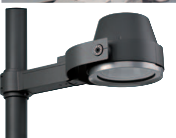
Luminaire Urban Scene