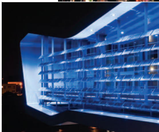
La Cité de la voile Éric Tabarly